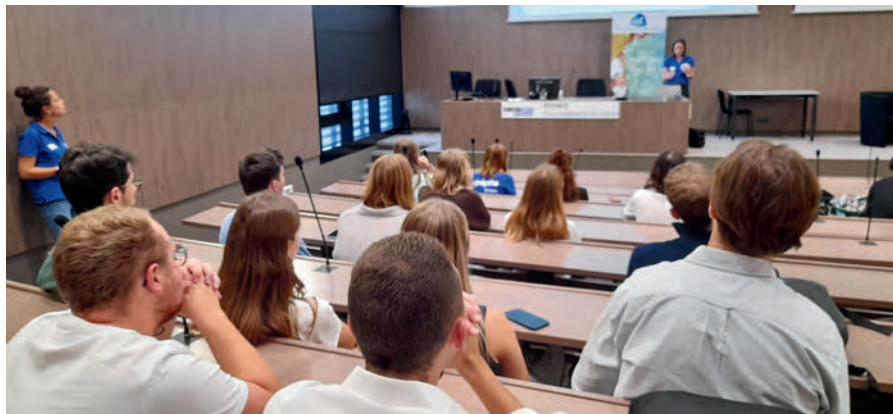
Soirée de lancement, Rennes - Octobre 2023

Une intelligence artificielle au service du plaisir sexuel solitaire pour un moment intime plus immersif et épanouissant !