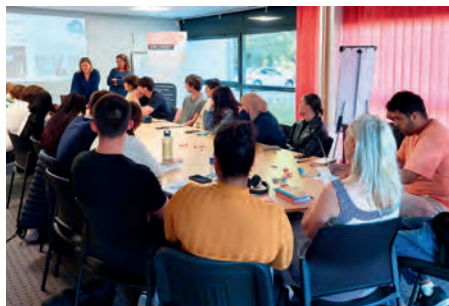
Soirée de lancement - Octobre 2023

Terrarium modulable et connecté à une application afin de faciliter l'acquisition de reptiles en préservant leur bien-être.